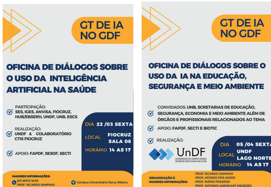
Figura 1 - Folders de divulgação das oficinas realizadas